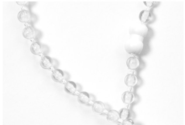
Kulkedja med delbar koppling