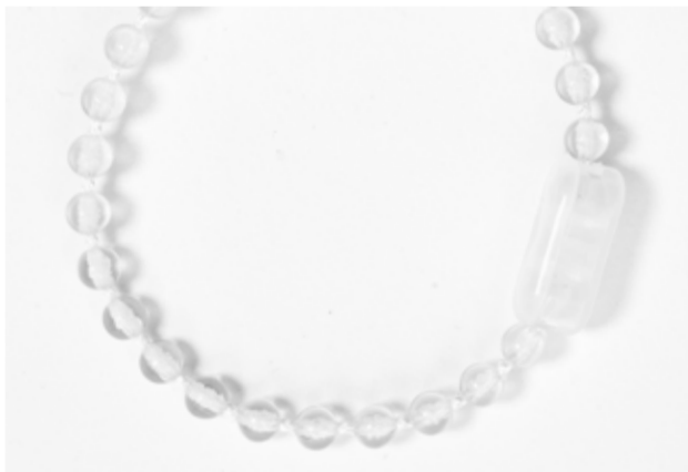
Kulkedja med fast kedjelås