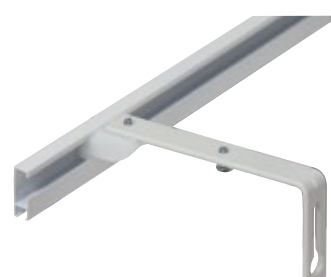
Vinkelfäste Art.nr. 6110-02