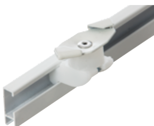
Vridfäste Art.nr. 4015