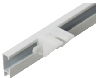
Takfäste Art.nr. 4029