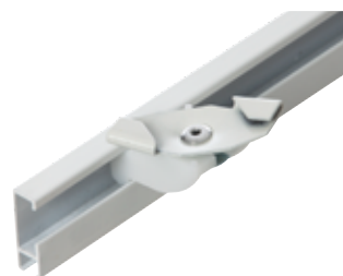
Vridfäste Art.nr. 4010