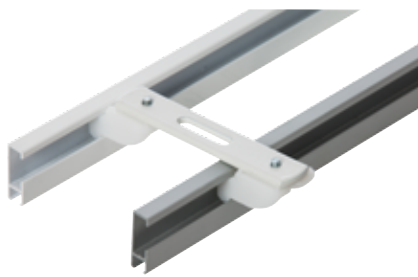
Takfäste Art.nr. 6180-02