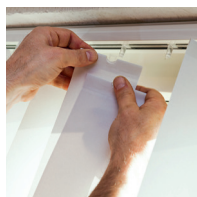
Lamellen trycks upp i glidet tills det klickar.