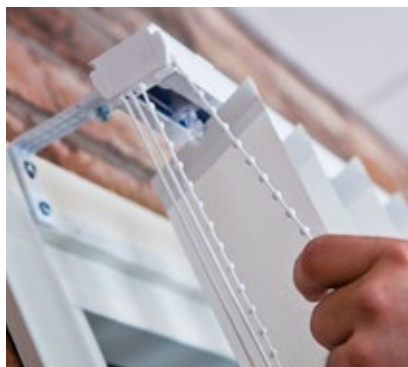
Vi använder oss av kulkedja och lina