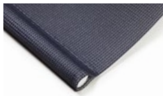
Insydd bottenlist Standardutförande

Dubbelmontering, kontakta Lindhs för pris och info.