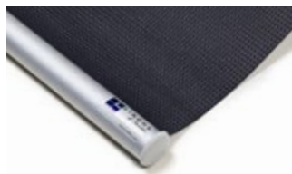
Bottenlist rund, aluminium Art.nr. R9010