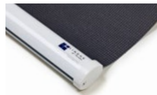
Bottenlist oval, vit Art.nr. R90815