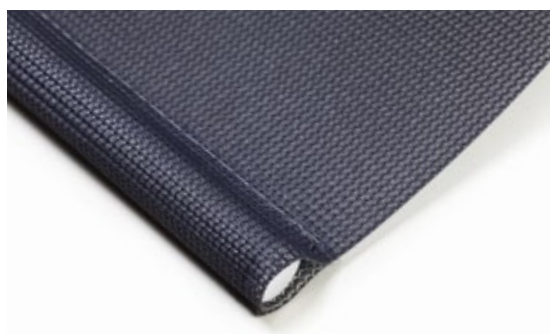
Insydd bottenlist Standardutförande