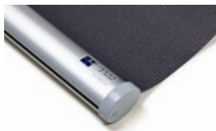
Bottenlist oval, aluminium Art.nr. R90810