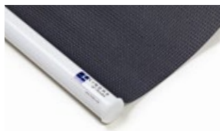
Bottenlist rund, vit Art.nr. R90805