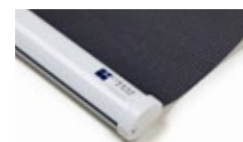
Bottenlist oval, vit Art.nr. R90815

Dubbelmontering, kontakta Lindhs för pris och info.