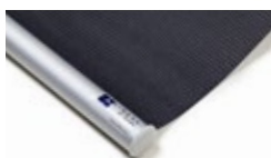
Bottenlist rund, aluminium Art.nr. R9010

För Lindhs Modell 470 kan vissa tillval göras vid beställning, såsom bottenlist i olika varianter.