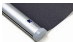
Bottenlist oval, aluminium Art.nr. R90810