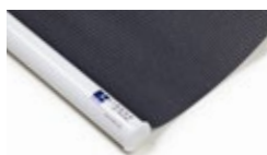
Bottenlist rund, vit Art.nr. R90805