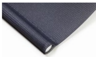
Insydd bottenlist Standardutförande