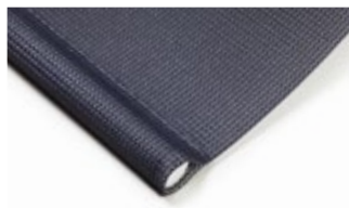
Insydd bottenlist Standardutförande

Dubbelmontering, kontakta Lindhs för pris och info.