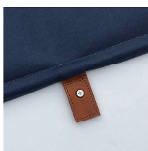
Läderstropp med lås. Art.nr. PB28171