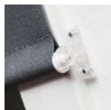
Underlist med ändplugg för krok, grå underlist. Art.nr. PB90832

För Lindhs Modell 835 kan vissa tillval göras vid beställning.