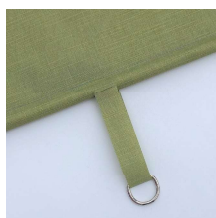
Dragband med D-ring. Art.nr. PB28170