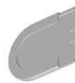
Täckbricka Art.nr. R38991