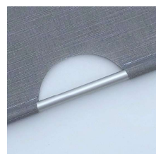
Greppgardin finns i fyra färger, vit, svart, aluminium och antikmässing. Art.nr. R90830-60