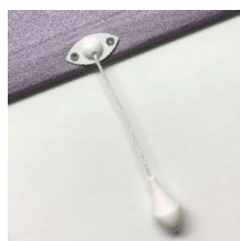
Dragsnöre med lintofs (std). Art.nr. PB28171