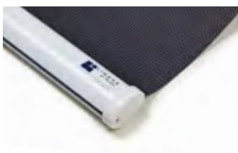
Oval, vit Art.nr. R90815 (RAL 9016)

För Lindhs Modell 560 kan vissa tillval göras vid beställning, så som underlist i olika varianter.