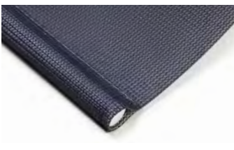
Rund, insydd Art.nr. R90805 insydd