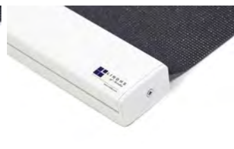
Platt, vit, för borstlist. 790 gr Art.nr. R90920 (RAL 9016)