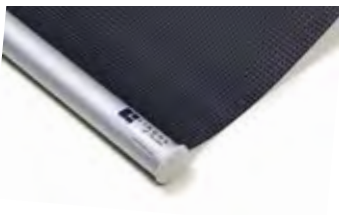
Rund, aluminium Art.nr. R90800