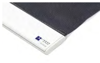
Platt, vit, för borstlist. 380 gr Art.nr. R90910 (RAL 9016)