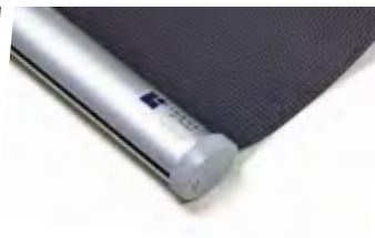
Oval, aluminium Art.nr. R90810