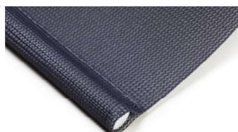
Rund, insydd Art.nr. R90805 insydd