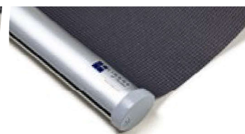
Oval, aluminium Art.nr. R90810