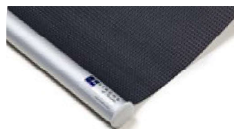
Rund, aluminium Art.nr. R90800