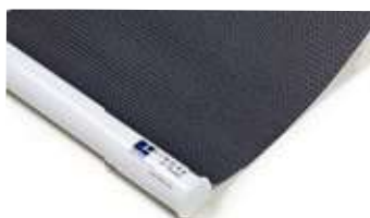
Rund vit underlist, standardutförande Art.nr. P90805 (RAL 9016)