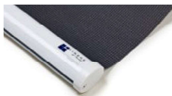
Oval, vit Art.nr. R90815 (RAL 9016)

För Lindhs Modell 470 kan vissa tillval göras vid beställning, såsom underlist i olika varianter.