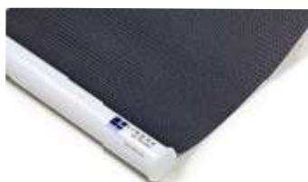
Rund vit underlist, standardutförande Art.nr. P90805 (RAL 9016)