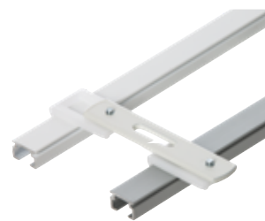
Takfäste cc 65 mm